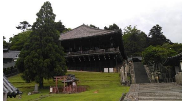
下から見た二月堂