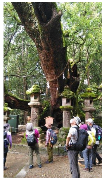
若宮神社前の樹齢???年 大クスの木を見上げる