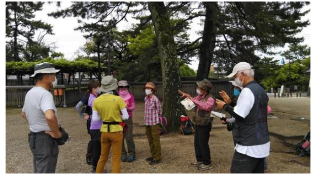
五重の塔前の広場にてSLのヤママップ講座中