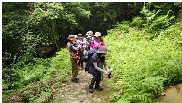
何？ 花？ 虫？